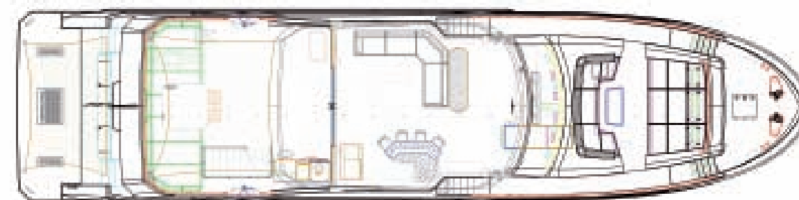
Sobre puente | Bridge deck