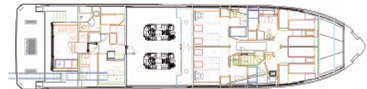
Cubierta inferior | Lower deck

Eslora total | Maximum length 27,43m · Eslora de flotación | Waterline length 23,18m · Manga máxima | Maximum beam 6,71m · Calado | Draft 1,73-1,79m · Desplazamiento | Displacement 93,800kg · Motores | Engines twin MTU 16V2000 2600hp · Velocidad máxima | Maximum speed 23 nudos | knots · Combustible | Fuel capacity 11,356l · Deposito agua | Water capacity 1,704l · Diseño interior y exterior | Interior & Exterior design Evan K. Marshall · Arquitectura naval | Naval architecture Arrabito Naval Architects · Astillero | Shipyard Ocean Alexander